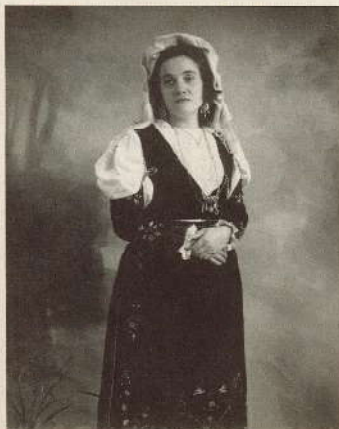
ANTICO COSTUME DURONIESE

Via Pescaglia, 10b/c/d - Roma Tel. 06/5504288 - 55260357