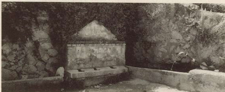
LA FONTE CANNAVINE COME È OGGI.

ABBIAMO BISOGNO DI FOTO D'EPOCA. SARANNO RESTITuite