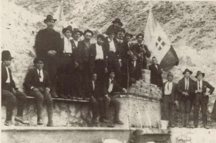
QUESTI SIGNORI TUTTI ABITANTI NELLA FRAZIONE S.MARIA, LAVORARONO GRATUITAMENTE PER COSTRUIRE LA FONTANA.

(Domenica 6 marzo 1994) nonostante le dichiarazioni dell'amministratore unico della WORLD TRADE DUE, Consigli Guido, la popolazione di Duronìa si è potuta rendere conto, in realtà, che la società di Genova, nata soltanto il 12/4/90, non vanta specifiche esperienze nel settore dell'imbottigliamento.