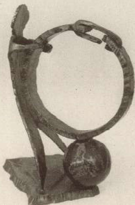
L'UOMO E IL DESTINO

Il centro di educazione permanente del Comune di Torella del Sannio, dopo un lungo periodo di inattività, ha riaperto i battenti con una iniziativa di rilievo: la mostra di scultura di Fernando Izzi. L'artista, Torellesse e fautore da sempre in un impegno per la riqualificazione culturale del Molise, ha presentato l'ultima linea di manufatti di sua creazione: tavoli, consolle, candelieri, soprammobili di ogni tipo: oggetti nati nei ritagli di tempo e sovente con ritagli di materiali di risulta. Il lavoro artigianale è stato, dalla rivoluzione industriale ottocentesca in poi, sempre più relegato ad una funzione secondaria, perdendo via via significazioni e dignità che lo avevano caratterizzato nei secoli precedenti: la qualità di oggetti prodotti dall'industria a basso costo ha invaso il mercato ed il buon gusto, spesso ne ha fatto le spese; chiunque avvertisse una pulsione artistica o creativa era costretto ad esprimerla a tempo perso. Fernando Izzi non